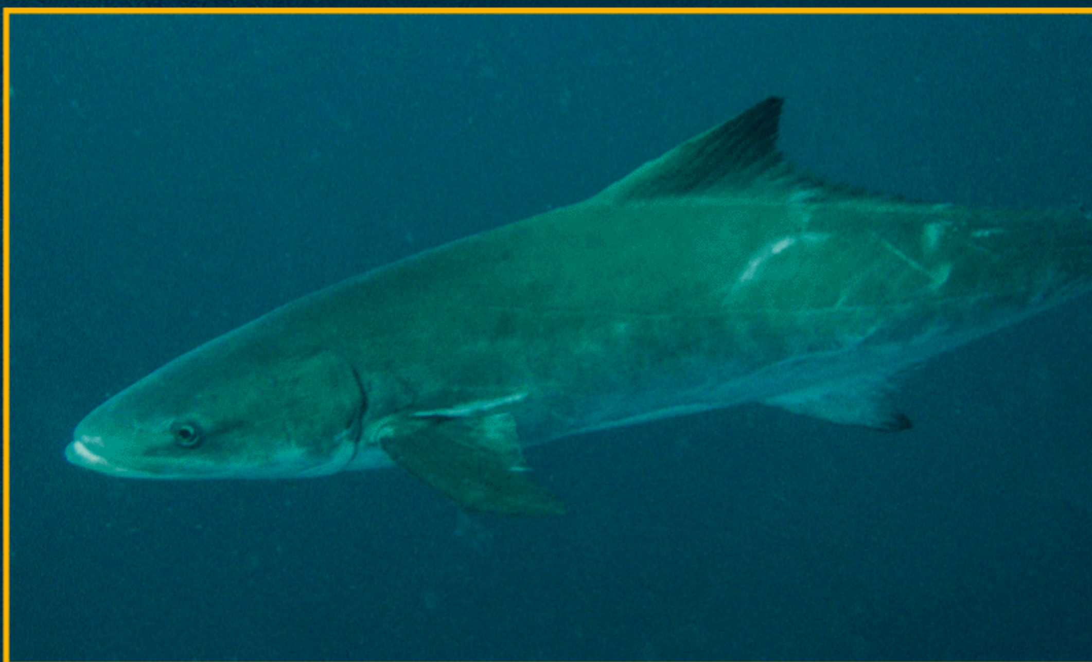
► Крупная кобия в толще воды.

На следующий день, однако, поднялся сначала ветерок, и не сказать даже, чтоб сильный, но море сразу покрылось крутой волной с барашками, и народ на боте тошнило и выворачивало. Вода приобрела зеленый оттенок, видимо, северное течение в тот день преобладало над Гольфстримом,